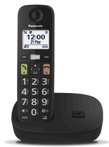
Telefono cordless digitale KX-TGU110