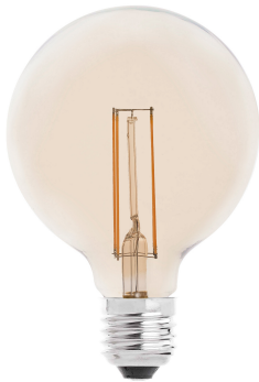
Lampadina GLOBO FILAMENTO LED AMBRA E27 4W 2200K