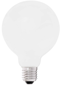
Lampadina G95 OPACA LED E27 8W 2700K