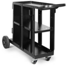
CARRELLO - COSMOPOLITAN 803079