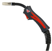
MT15 TORCIA MIG 3M (RED) 742180