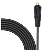
CAVO 25 MMQ 3 M SPINA ATLAS 25 124466