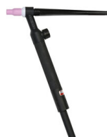
ST9V TORCIA TIG AX25 4M 722563