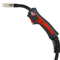
MT15 TORCIA MIG 5M 742182