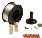
KIT SALDATURA ACCIAIO INOX D. 0,8 MM 802037