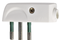
00206.B - Spina 2P+T 10A SPA11 90° bianco