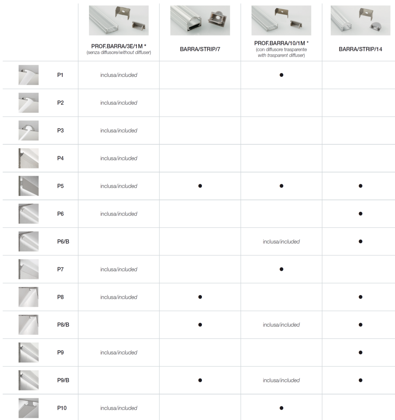
TABELLA COMPATIBILITA' TRA PROFILI IN ALLUMINIO E PROFILI IN GESSO / COMPARATIVE TABLE BETWEEN ALUMINIUM PROFILES AND PLASTER LINEAR PROFILES

* Diffusori abbinabili / Suitable diffusers