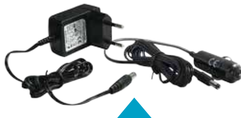
2 Caricabatterie: 220 V e 12 V

La lampada si accende automaticamente in caso di black-out elettrico